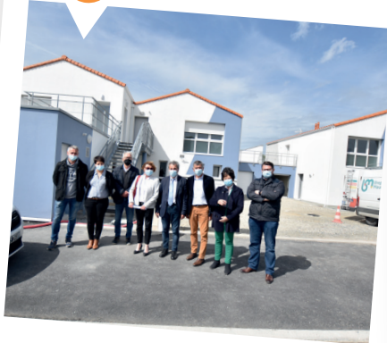
LES HERBIERS Résidence La Séraphina 8 logements locatifs