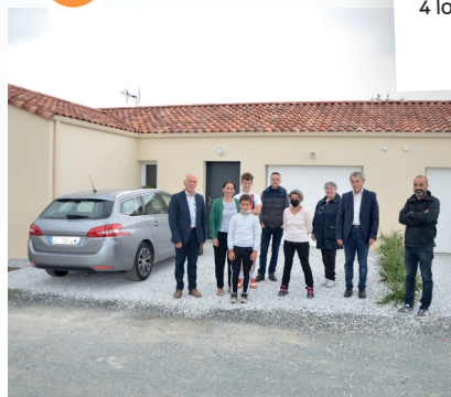
CHAUCHÉ Résidence Le Hameau des Prés 2 logements locatifs