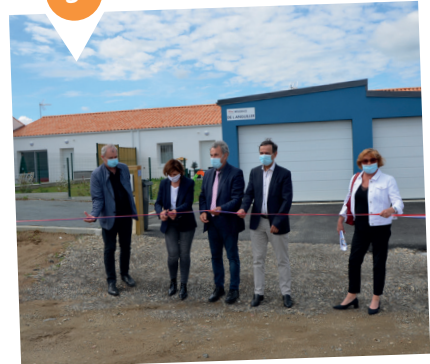
LES LUCS-SUR-BOULOGNE Résidence de l'Anguiller 4 logements locatifs