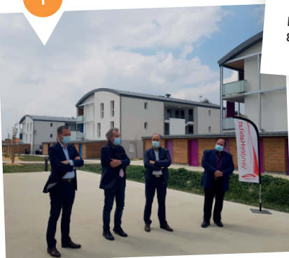
MORTAGNE-SUR-SÈVRE Résidence Le Chaintreau 27 logements locatifs